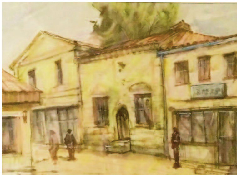
ЈАКУП ХАЈРО „СТАРА СКОПСКА ЧАРШИЈА“