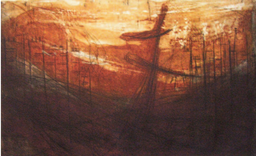
ШЌИПЕ МЕХМЕТИ „Урбан пејзаж“, комбинирана техника , 50x70,2012 год